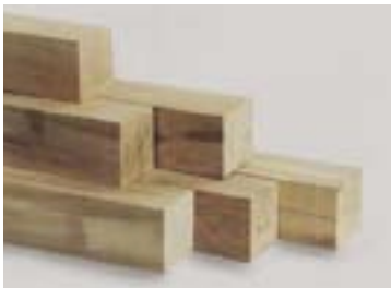
Reiberrauchzeuger für Kanthölzer