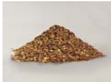
Glimmrauchzeuger für grobe Hackspäne