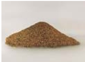
Glimmrauchzeuger für feine Sägespäne